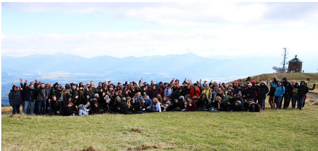
Wycieczka cieszy się ogromnym zainteresowaniem uczniów.

W czasie wycieczki zwiedzamy m. in. Wenecję, Villach, Wiedeń, wesołe miasteczko na Praterze i wiele innych cudownych miejsc.