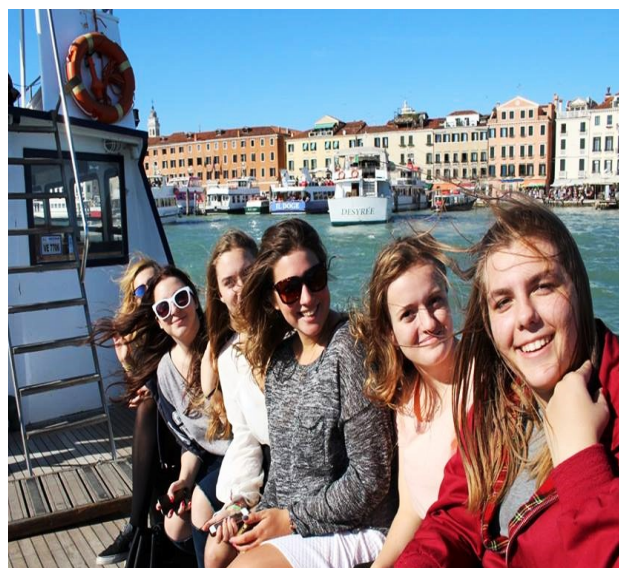
Podziwialiśmy również miasto na wodzie.