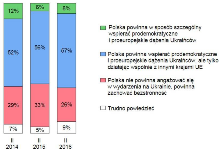
RYS. 3. JAK, PANA(I) ZDANIEM, POWINNA ZACHOWYWAĆ SIĘ POLSKA WOBEC WYDARZEŃ NA UKRAINIE? KTÓRA Z OPINII JEST PANU(I) NAJBLIŻSZA?